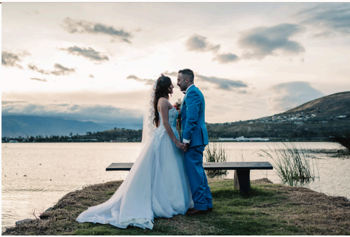
UNO SOLO CON LA NATURALEZA