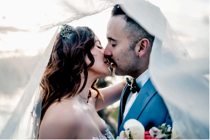
UN BESO QUE MARCA EL INCIO